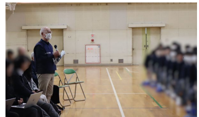
◆アイデアへの感想と講評

結びに・・・今回、この「キャリア教育」に携われた私たちは、素晴らしい「経験の積み重ね」をすることができたのではないかと思います。それが、今後の私たちの楽しい活動に繋がります。