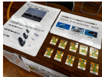
□名古屋港のあれこれ、資料